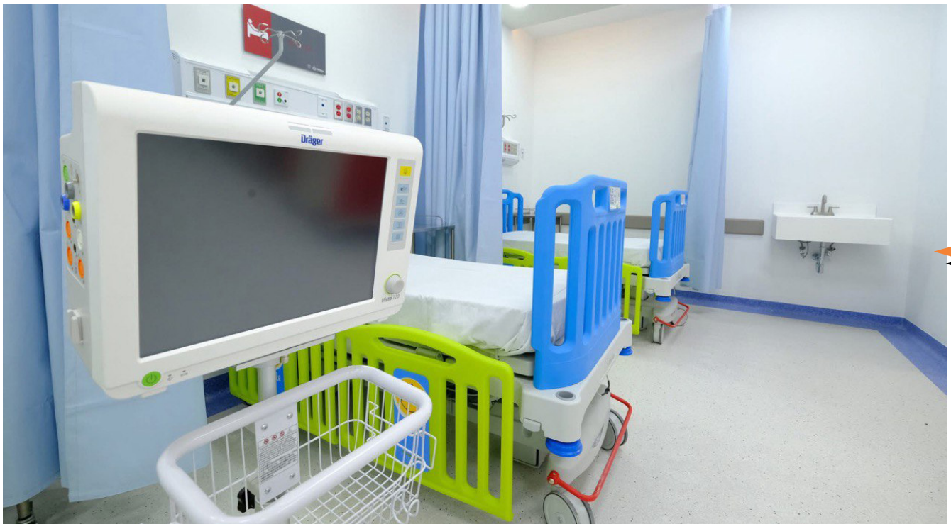
Espacios de primer nivel para atender el cáncer infantil en Jalisco.