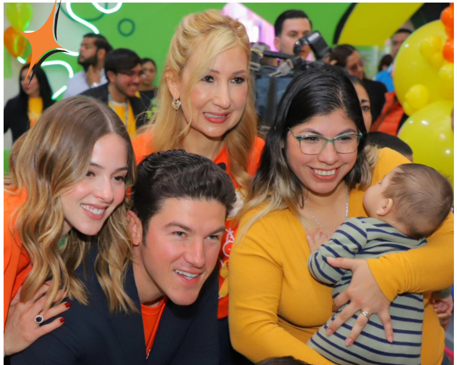
Nuevo León festejó 3 años de la cobertura universal de cáncer infantil

Los buenos gobiernos de Movimiento Ciudadano han demostrado con hechos su compromiso de garantizar cobertura universal para el cáncer infantil . En Jalisco y Nuevo León ya es una realidad y ahora buscamos que lo mismo suceda en la Ciudad de México. Movimiento Ciudadano abanderará esta causa buscando que los más de 1.5 millones de niñas y niños de la capital del país que viven con esta enfermedad tengan acceso gratuito a tratamientos y medicamentos de calidad. ¡La lucha por la vida de nuestros niñas y niños, no se detendrá!