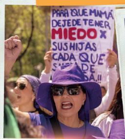
MUJERES EN MOVIMIENTO