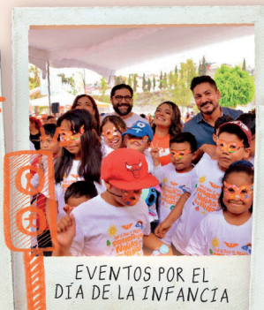
EVENTOS POR EL DÍA DE LA INFANCIA