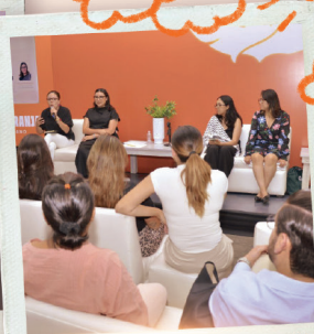
CONVERSATORIO DE MUJERES