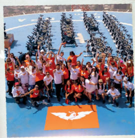
EVENTO POR EL DÍA DE LAS MADRES