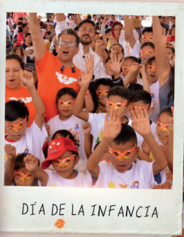
DÍA DE LA INFANCIA