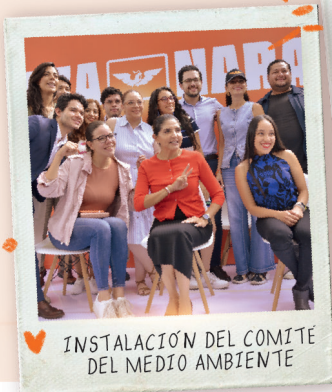
INSTALACIÓN DEL COMITÉ DEL MEDIO AMBIENTE