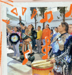
INSTALACIÓN DEL COMITÉ DE PUEBLOS Y BARRIOS ORIGINARIOS, COMUNIDADES AFRODESCENDIENTES