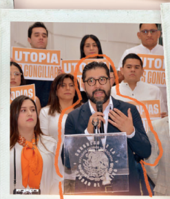
UTOPIAS SÍ, PERO NO ASÍ