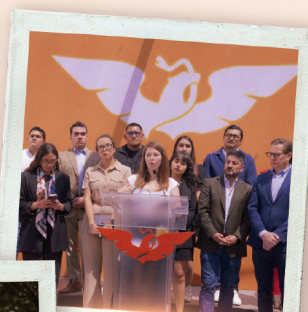
PROTOCOLO CONTRA LA VIOLENCIA Y EL ACOSO SEXUAL EN LA ALCALDÍA