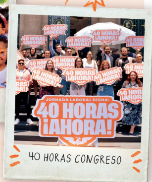
40 HORAS CONGRESO