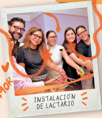
INSTALACIÓN DE LACTARIO