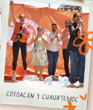
COYACÁN Y CUAUHTÉMOC