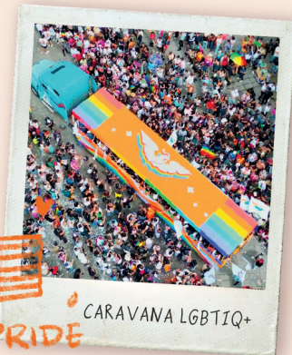
CARAVANA LGBTQ+ PRIDE