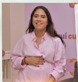
ALIMENTAR CON AMOR