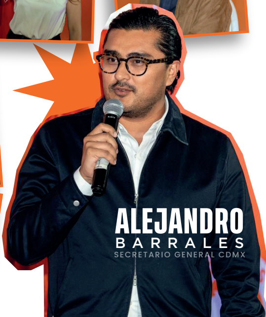
ALEJANDRO BARRALES SECRETARIO GENERAL CDMX